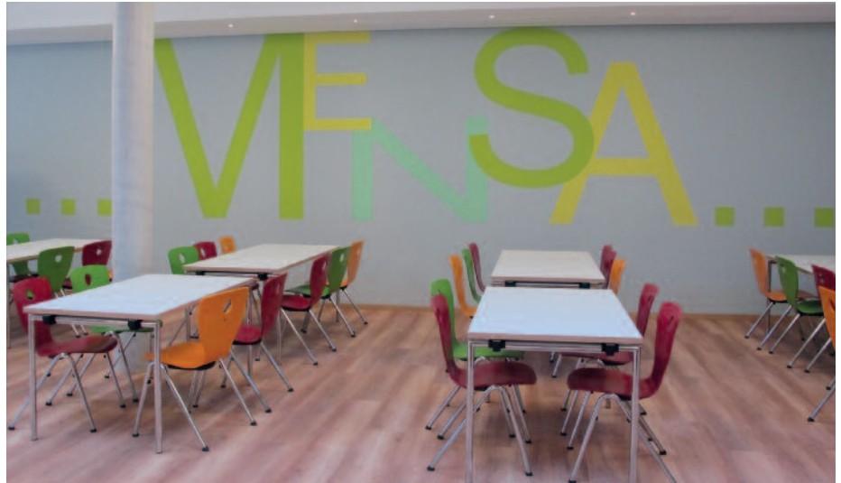
In der Schulmensa bekommen die Kinder ein umfassendes Mittagsmenü serviert.

„Wir sind sehr dankbar, dass wir in Zusammenarbeit mit der