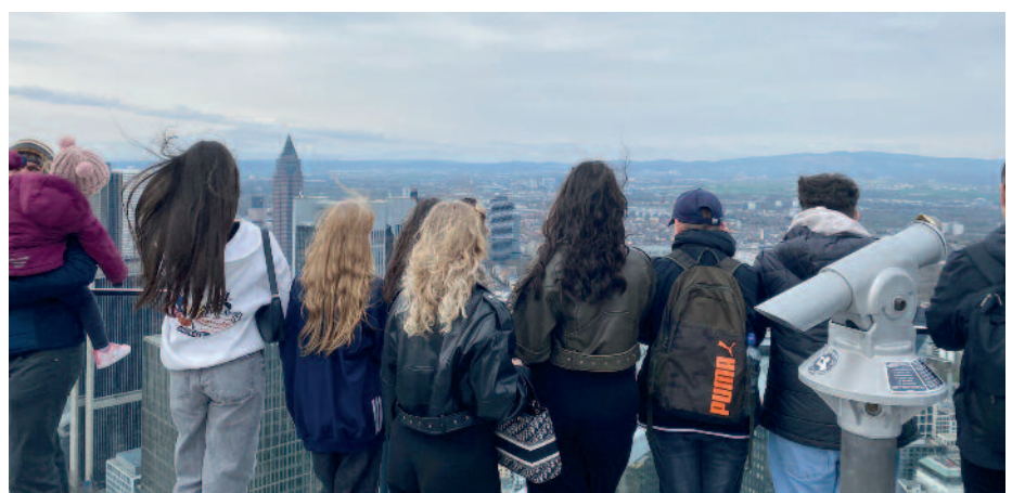
Die Aussichtsplattform auf dem 192 Meter hohen Main-Tower garantiert eine grandiose Aussicht.

Recht früh ging es am Mittwoch, 27. März, weiter. Um 9.30 Uhr starteten wir mit Jugendlichen im Alter von 12 bis 16 Jahren im Bus des Kreisjugendrings in Richtung Frankfurt am Main. Nach einer staufreien Anfahrt bei noch sonnigem Wetter ging es dann 192 Meter hinauf auf die Aussichtsplattform des Main-Towers, von dem wir die Aussicht über ganz Frankfurt genießen konnten. Nachdem alle tolle Bilder aufnehmen konnten, machten wir uns wieder auf den Weg nach unten, wo sich die Jugendlichen in Kleingruppen aufteilen durften, um selbst einmal die Großstadt zu erkunden. Gegen Nachmittag wurde es dann leider zunehmend stürmisch und wir waren froh darüber, dass der Großteil des am Abend folgenden Regenschauers erst bei unserer