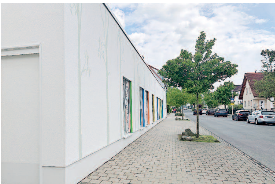
Ende April 2023 konnte der Erweiterungsbau des St. Franziskus Hauses für Kinder eingeweiht werden.

Um möglichst vielen Kindern einen abwechslungsreichen und schmackhaften Mittagstisch ermöglichen zu können, wird seitens der Stadt Hallstadt auch das jährliche Defizit der Schulmensa in Höhe von etwa 100.000 Euro vollends übernommen.