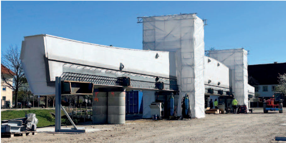
Seit Frühjahr 2026 wird das neue Brückenbauwerk vormontiert.