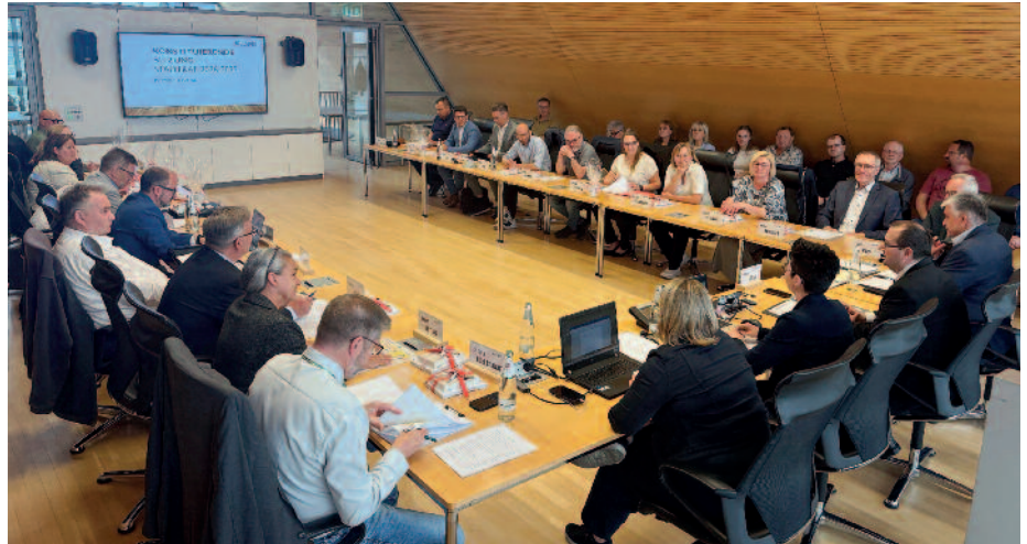
Die konstituierende Sitzung fand am Mittwoch, 6. Mai, statt.